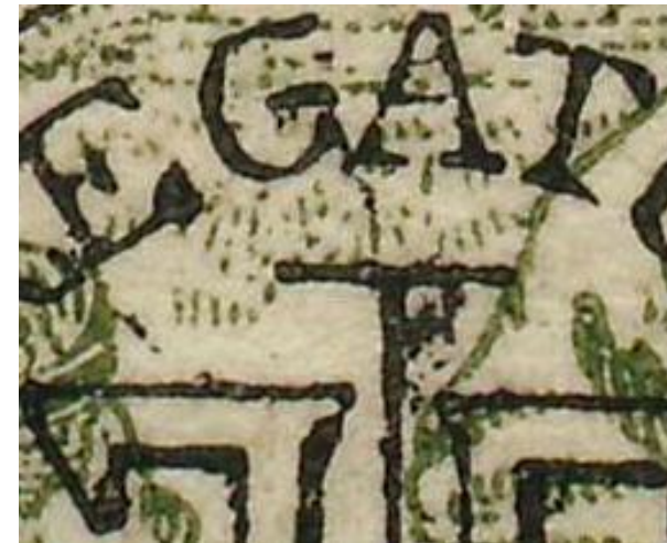
Maiers 40 bani