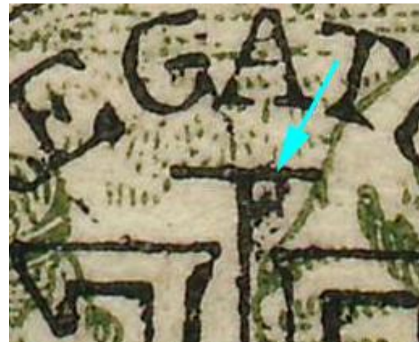
Detail maaiers 40 bani