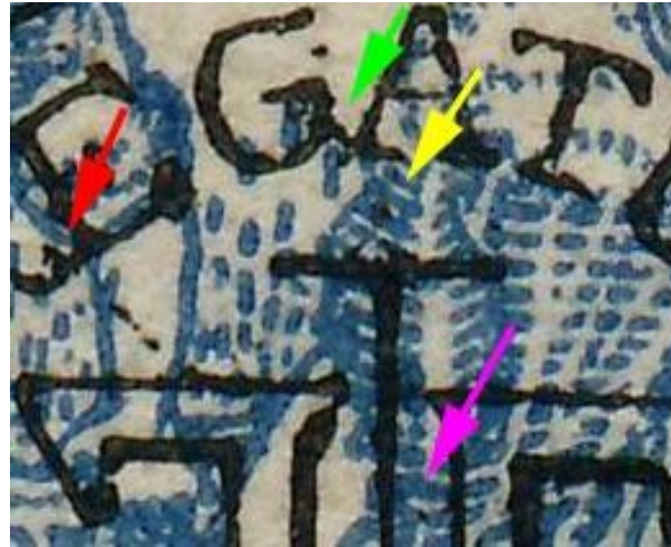
Maiers 25 bani