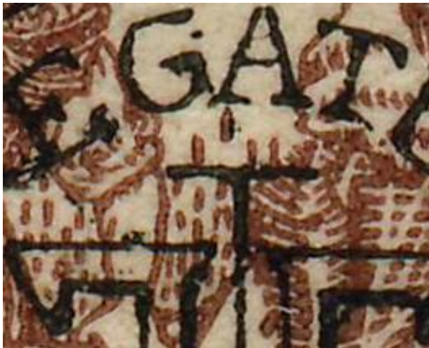
Maiers 35 bani