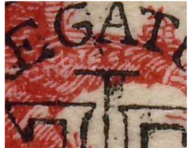
Oorlog 40 bani