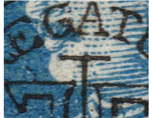
Karl 25 bani