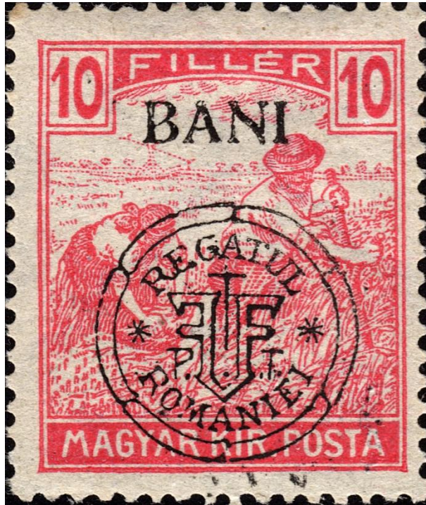
Maaiers 10 bani