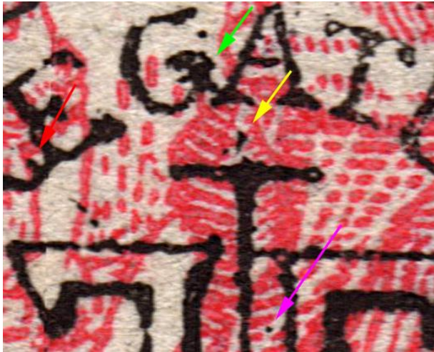
Maiers 10 bani